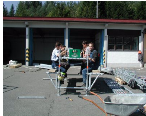
Abb. Y / 12