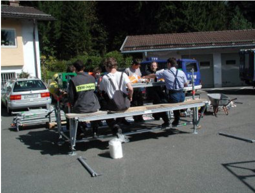
Gut zu erkennen die maximale Belegung der Biertischgarnitur mit 10+X Personen. (Abb. Y / 13)